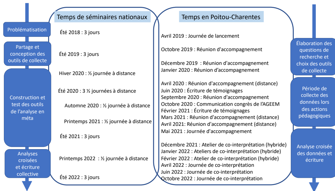
Figure 4 : articulation entre temps à l'échelle « macro » et temps « méso » en Poitou-Charentes