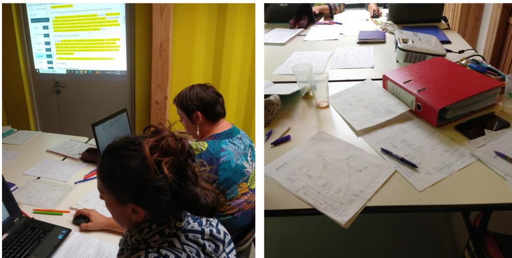
Figure 5 : Exemple d’atelier de co-interprétation des données en Poitou-Charentes.

L’atelier du CIDEF se termine par le bilan provisoire du dispositif à l’échelle nationale relativement aux trois objectifs fixés. Sur les objectifs de recherche, les savoirs sont partagés dans les rapports territoriaux, des articles de recherche et au sein de différentes communications. Concernant l’objectif de recherche-action, il est fait état de l’importance de l’éthique relationnelle et de la non-idéalisation du processus. A la croisée entre les objectifs de recherche-action et d’actions, les apprentissages et la dimension formatrice commencent à émerger et font l’objet d’investigations spécifiques complémentaires (Zwang & Girault, 2023). De plus, les acteurs et actrices engagés témoignent d’ores et déjà des bénéfices en termes de légitimation de la pratique de « classe dehors », enjeu important en particulier au début de la RAP c’est-à-dire avant « l’engouement » post-confinement.